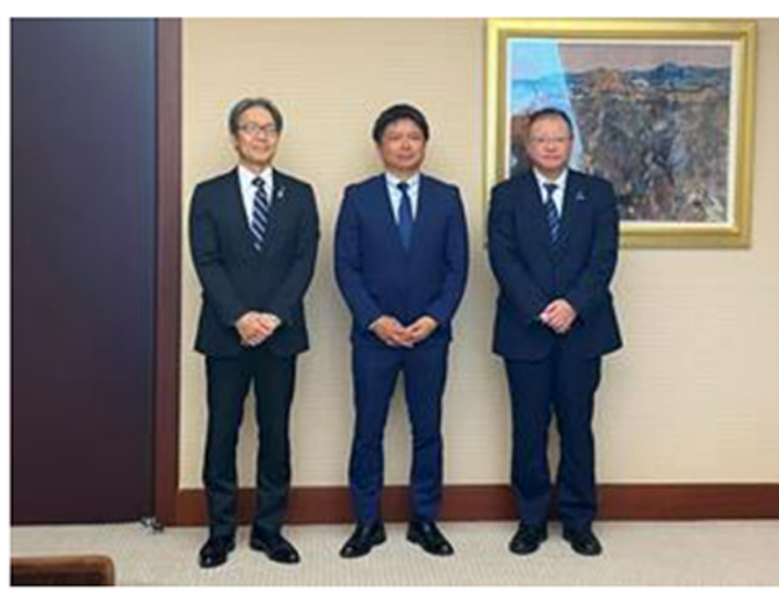
進出報告会（左から新潟県笠烏副知事、磯代表取締役、新潟市井崎副市長）

このたび、新潟県とともに誘致を進めてきた株式会社ブラージュ（本社：東京都品川区）の磯代表取締役が、本市進出の報告を令和6年5月28日（火曜）に行いました。